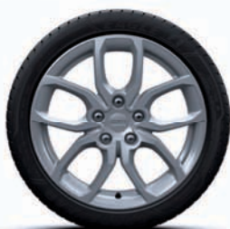
Disky kolies z ľahkej zliatiny 17" sivá Silver