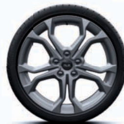
Disky kolies z ľahkej zliatiny 18" Radicale ocelovo sivé