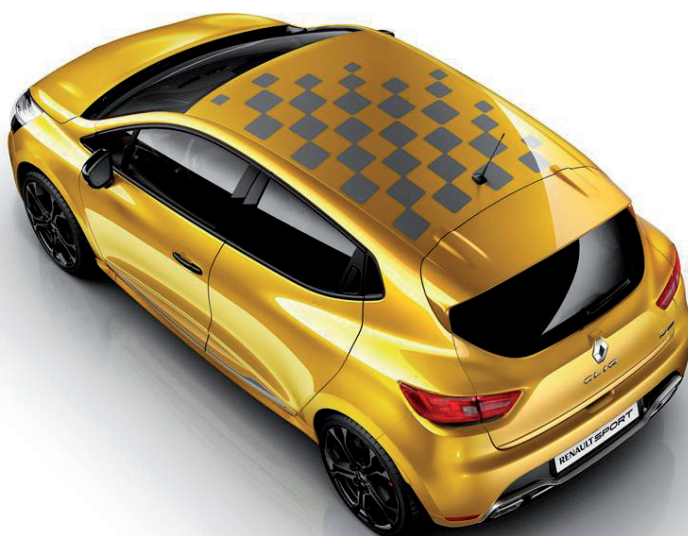
Polep strechy „Šachovnica“

V cene vozidla nie je zahrnutá povinná výbava. Nezáväzná cena vrátane DPH odporúčané spoločnosťou Renault Slovensko spol. s r. o. sú platné od 1. 1. 2014. Renault Slovensko spol s r. o. si vyhradzuje právo zmeny ceny a výbavy vozidla bez konzultácie. Informácie o aktuálnej ponuke získate v obchodnej sieti Renault.