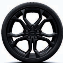
Disky kolies z ľahkej zliatiny 18" Radicale Čierna Brillant