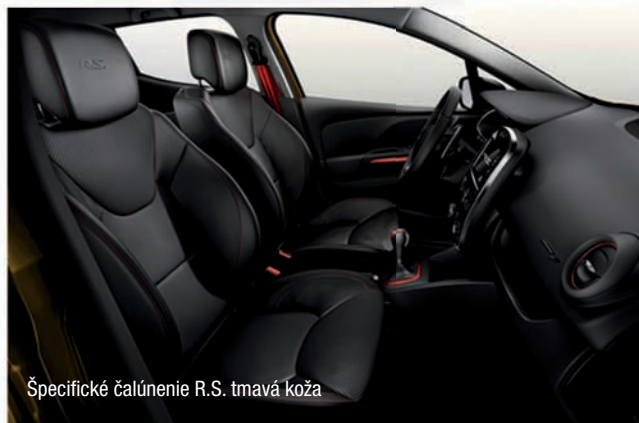
Špecifické čalúnenie R.S. tmavá koža